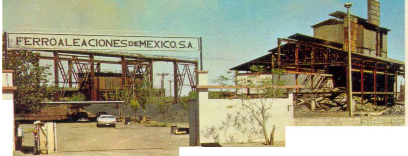
Planta de Ferroaleaciones de México, S.A Gómez Palacio, Dgo.

Otro eslabón de la cadena productiva eran las minas de donde se obtenían las ferroaleaciones. Localizadas en Chihuahua, Durango y Zacatecas. Que eran administradas por la empresa Ferroaleaciones de México, S.A., la cual formaba parte del Grupo Fundidora. De dichos minerales se obtenían los siguientes productos: Ferromanganeso, Silicomanganeso, Ferrosilicio, Ferrovanadio, Ferromolibdeno, Ferrocolumbio.