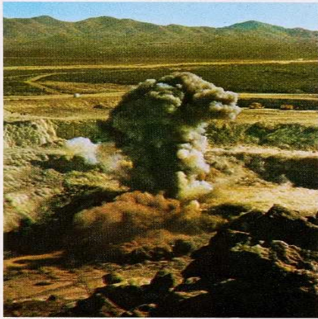
Minas de Hercules, Hercules, Coah.