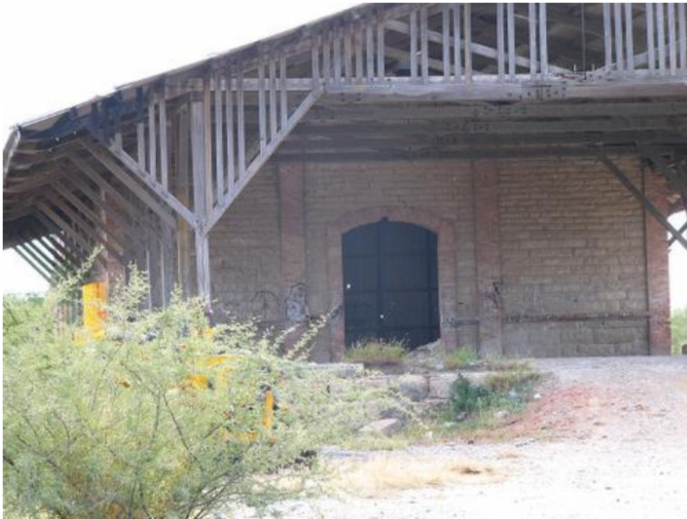
Otras instalaciones de La Estación