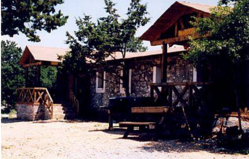
Autor: Alfredo Jiménez

Las cabañas son remodelación de las casas de mineros de hace más de 100 años de antigüedad. Se conservan sus muros de piedra.