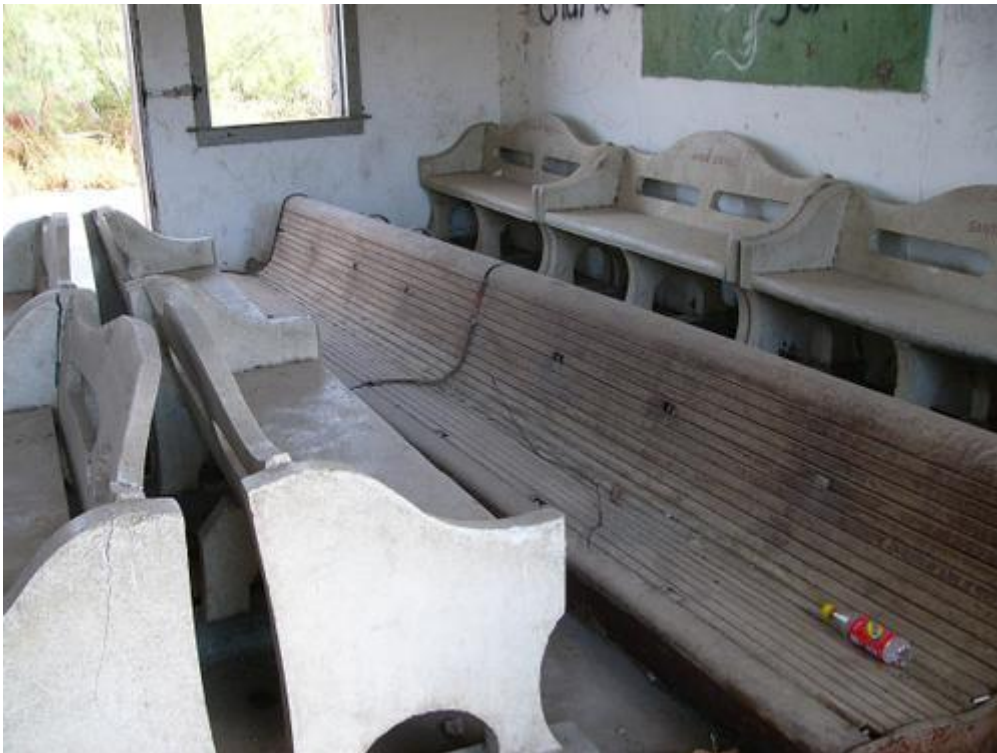
La sala de espera... esperando... al INAH