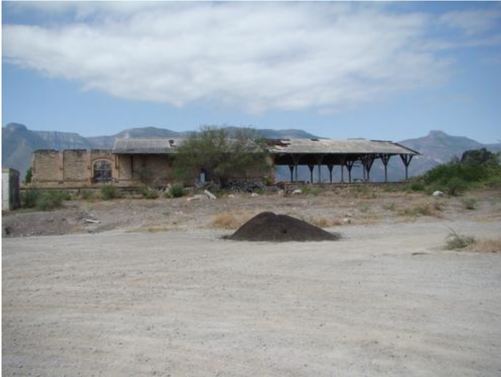
Una vista más de las deterioradas instalaciones