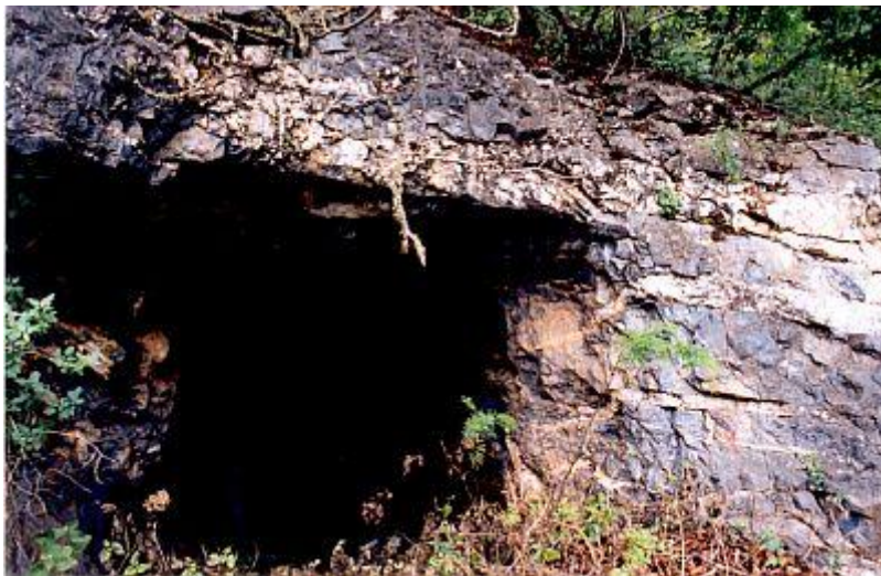
Autor: Alfredo Jiménez

Las cabañas son remodelación de las casas de mineros de hace más de 100 años de antigüedad. Se conservan sus muros de piedra.