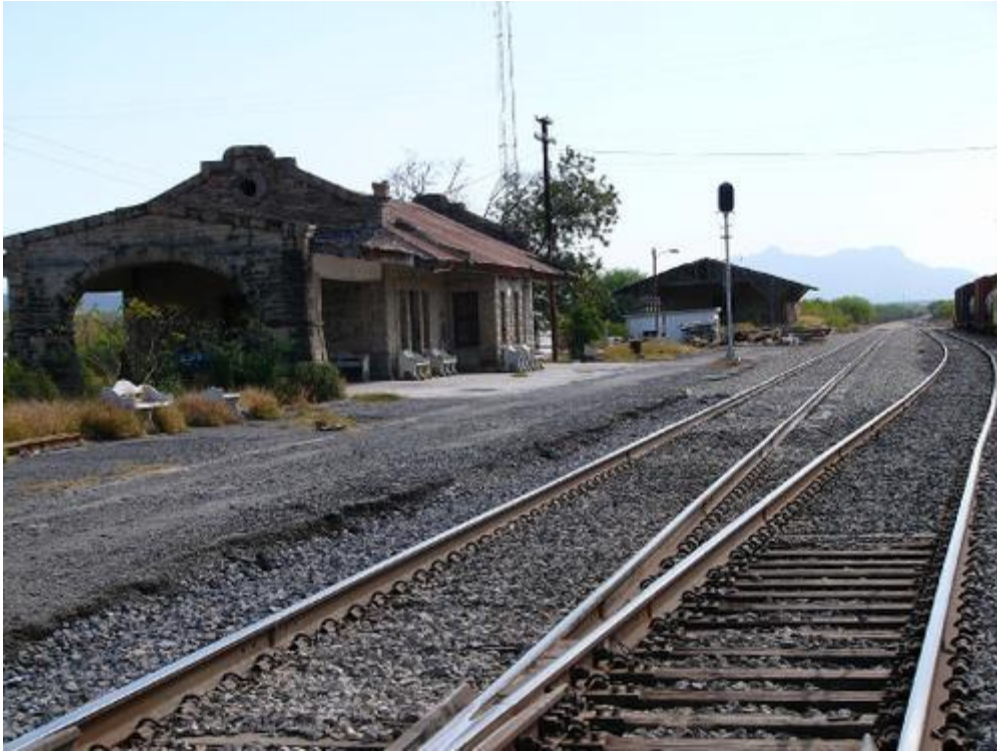
Antigua Estación del Tren