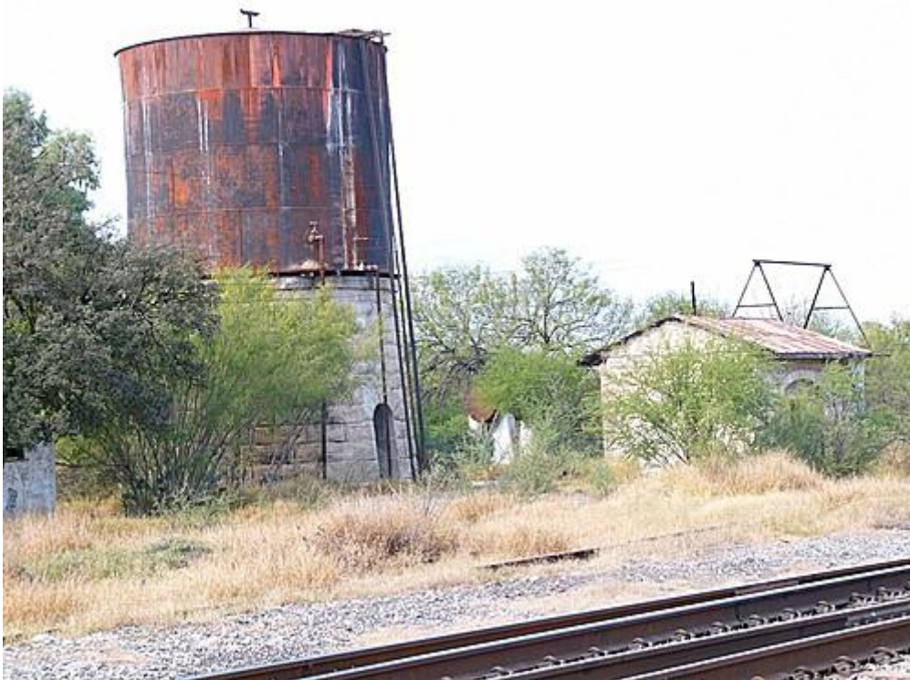
Tanque de agua para las máquinas de vapor