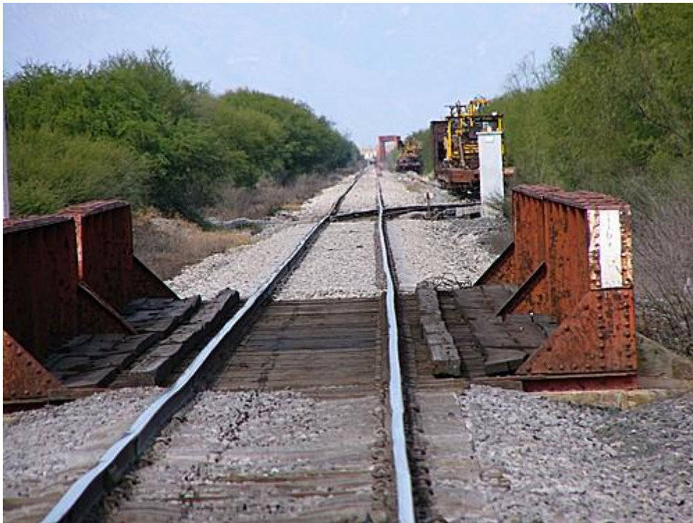
En primer plano, el puente de fierro, y al fondo el puente sobre el Río Sabina